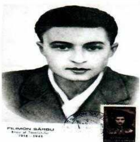
Imaginea lui Filimon Sîrbu pe o maximă filatelică și un timbru (1951).

Filimon Sîrbu (n. 10 august 1916 , satul Herepeia , comuna Vetei , județul Hunedoara – d. 19 iulie 1941 , Închisoarea Jilava ) a fost un activist comunist și militant antifascist român, executat de către autoritățile militare în perioada celui de-al doilea război mondial, fiind acuzat de sabotaj. După instaurarea regimului comunist în România, el a fost declarat erou de autoritățile statului român.