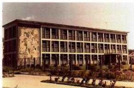
Cladirea actuală, dată în folosință în anul 1959